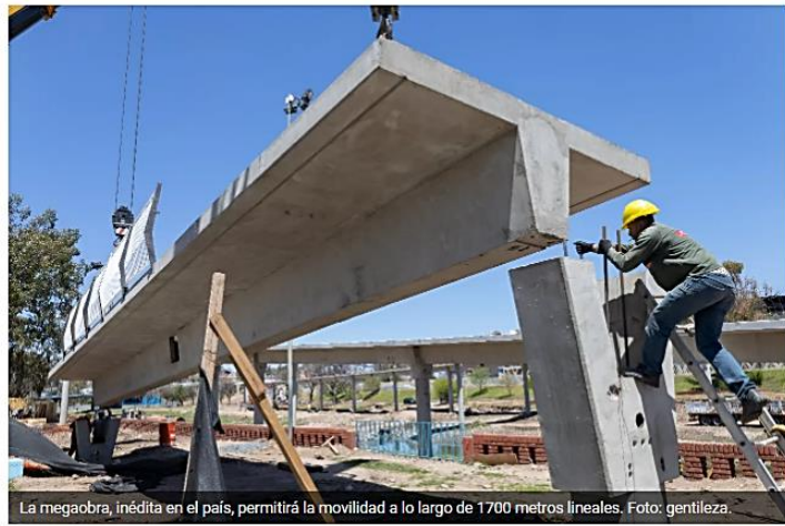
La megaobra, inédita en el país, permitirá la movilidad a lo largo de 1700 metros lineales.

https://lmdiarario.com.ar/contenido/374013/avanza-la-ciclovía-elevada-que-unira-barrio-juniors-con-el-suquia