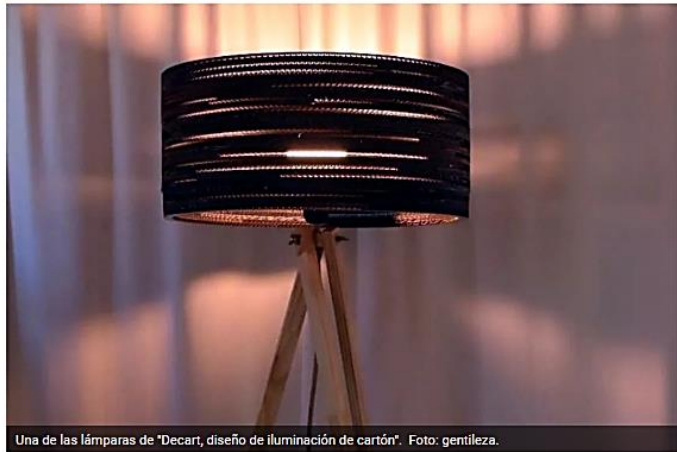
Una de las lámparas de "Decart, diseño de iluminación de cartón".