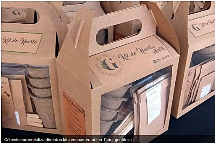
Génesis comercializa distintos kits ecosustentables.

Entre los mismos, se pueden encontrar sahumeros—esencias para hornitos; almohaditas terapéuticas; pomadas herbales; tinturas madre; microdosis herbales, o hidrolatos, entre otros.