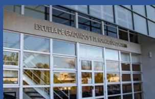
Secretaría de Graduados FCEyN

Junto a la Caja de Previsión - Ley 8470- De la Ingeniería, Arquitectura, Agrimensura, Agronomía y Profesionales de la construcción de la Provincia de Córdoba, queremos homenajear, con la entrega de un diploma, a la Comunidad Graduada de nuestra Facultad de hace 40 años o más