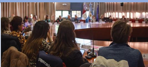
Las elecciones para renovar representantes en el Consejo Superior y los consejos directivos serán el 15 y 16 de mayo

Con el propósito de fomentar una mayor participación de la comunidad universitaria en el proceso eleccionario, en su última sesión ordinaria el Consejo Superior aprobó ampliar a dos días los comicios de 2024.